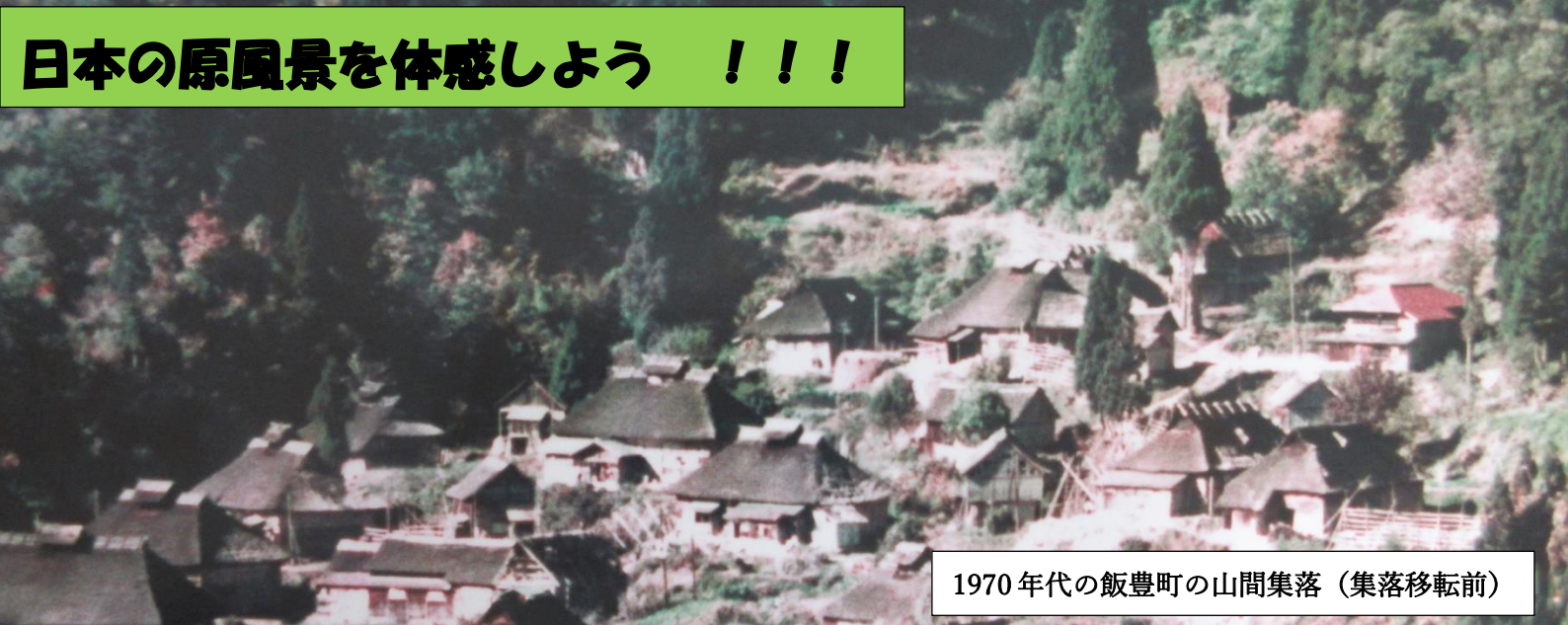
1970年代の飯豊町の山間集落（集落移転前）